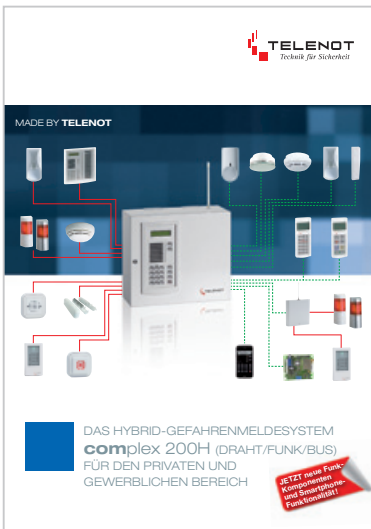
Prospekt „complex 200H“