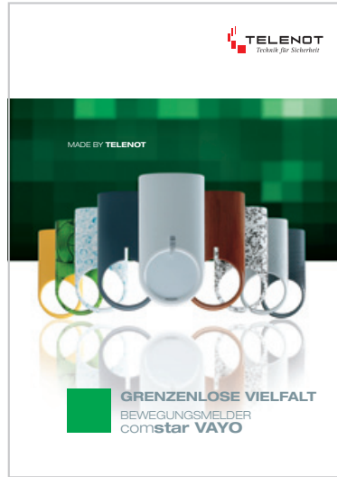
Prospekt „comstar VAYO“