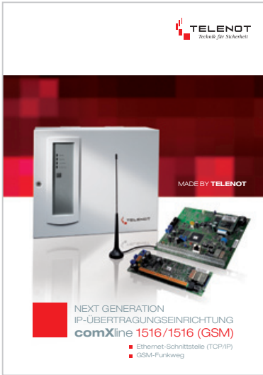
Prospekt „comXline 1516/1516 (GSM)“