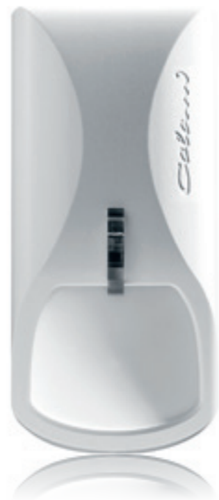
Das Gehäuse des Bewegungsmelders comstar stammt von Designer Luigi Colani.